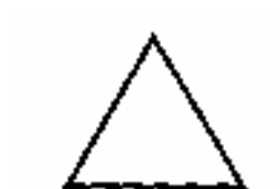
Tejas - Triângulo Vermelho

Como tivemos oportunidade de mencionar, o Akasha, ou Princípio Etérico, é a origem da criação dos elementos. O primeiro elemento que de acordo com os escritos orientais nasceu do Akasha, é Tejas, o princípio do fogo. Esse elemento, como todos os outros, não age só em nosso plano denso, material, mas em tudo o que foi criado. As características básicas do princípio do fogo são o calor e a expansão; é por isso que no começo da criação tudo era fogo a luz. A bíblia também diz: "Fiat lux - que se faça a luz". Naturalmente a base da luz é o fogo. Cada elemento, inclusive o fogo, possui duas polaridades, a ativa e a passiva, Le., Plus a Minus (mais a menos). A Plus é a construtiva, criadora, geradora, enquanto que a Minus é a desagregadora, exterminadora.