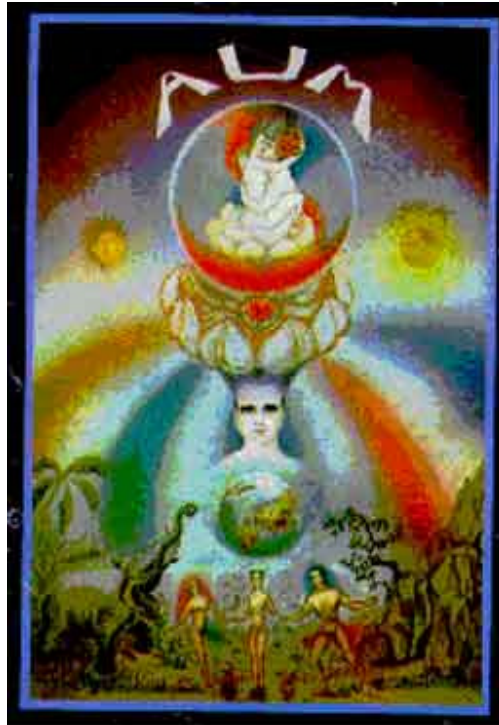
A Primeira carta do Tarô. Explicação do seu simbolismo.

Os reinos mineral, vegetal a animal, estão simbolicamente expressos na parte inferior da carta.