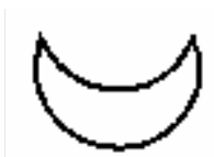
Apas - Crescente Prateado

No capítulo anterior tomamos conhecimento da criação e das características do elemento positivo fogo. Neste capítulo descrevo o princípio contrário, o da água. Assim como o fogo, ele também se formou a partir do Akasha, o princípio etérico. Em comparação com o fogo porém, ele possui características totalmente opostas; suas características básicas são o frio e a retração. Aqui também se tratam de dois pólos: o pólo ativo, que é construtivo, doador de vida, nutriente e preservador; e o negativo, igual ao do fogo, desagregador, fermentador, decompositor, dissipador. Como o elemento água possui em si a característica básica da retração, ele deu origem ao fluido magnético. Tanto o fogo quanto a água agem em todas as regiões. Segundo a lei da criação, o princípio do fogo não poderia existir se não contivesse um pólo oposto, ou seja, o princípio da água. Esses dois elementos, fogo e água, são aqueles elementos básicos com os quais tudo foi criado. Por causa disso é que em todos os lugares sempre temos que contar com dois elementos principais como polaridades opostas, além do fluido magnético e elétrico.