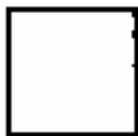
Prithivi - Quadrado Amarelo

Já dissemos que o princípio do ar não representa propriamente um elemento em si, a essa afirmação vale também para o princípio da terra. Isso significa que, do efeito alternado dos três elementos mencionados em primeiro lugar, o elemento terra formou-se por último, pois através de sua característica específica, a solidificação, ela integra em si todos os outros três. Foi justamente essa característica que conferiu uma forma concreta aos três elementos. Ao mesmo tempo porém foi introduzido um limite ao seu efeito, o que resultou na criação do espaço, da dimensão, do peso, e do tempo. Em conjunto com a terra, o efeito recíproco dos outros três elementos tomou-se quadripolar. O fluido na polaridade do elemento terra é eletromagnético. Como todos os elementos são ativos no quarto elemento(o da terra) toda a vida criada pode ser explicada. Foi através da materialização da vida nesse elemento que surgiu o "Fiat", o "faça-se".